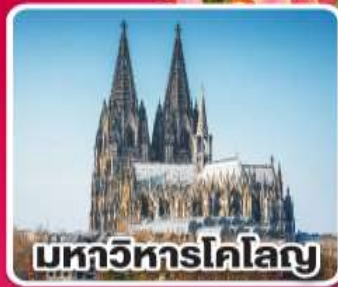
มหาวิหารโคโลญ

เที่ยวเก็บครบ เบนลักซ์ เบลเยียม เนเธอร์แลนด์ และลักเซมเบิร์ก