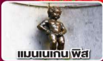
แมนเนเกน พิซ