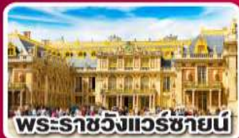
พระราชวังแวร์ซายน์