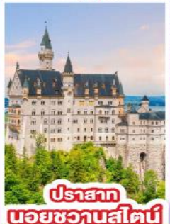
ปราสาท นอยชวานสไตน์