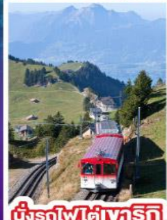
นั่งรถไฟใต้เขาเทริก