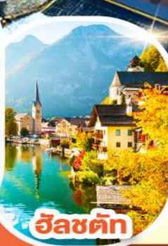
อินส์บรึค