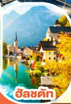
อินส์บรึค