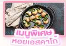
เมนูพิเศษ หอยออสคาโก

เยอรมัน เนเธอร์แลนด์ เบลเยียม ฝรั่งเศส Keukenhof