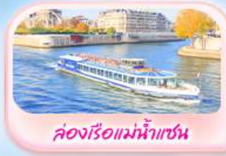
คลองเรือแม่น้ำแซน