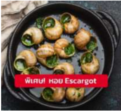
พิเศษ! หอย Escargot