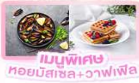
เมนูพิเศษ หอยมีสาซ+วอเฟิล