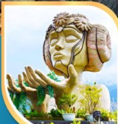
โมอาน่า ซาปา คาเฟ่