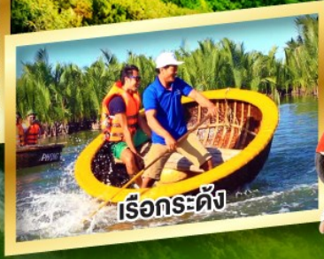
เรือกระดัง