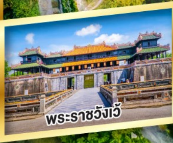
พระราชวังเว้