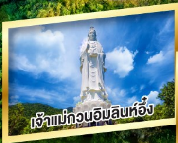
เจ้าแม่กวนอิมลินห์อิ่ง