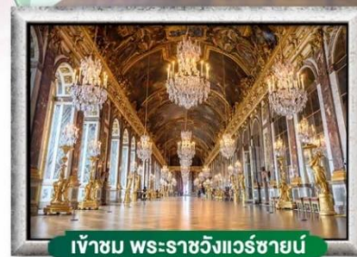
เข้าชม พระราชวังแวร์ซายน์