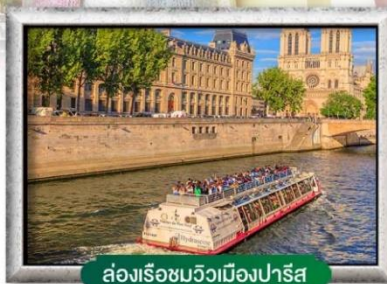
ล่องเรือชมวิวเมืองปารีส