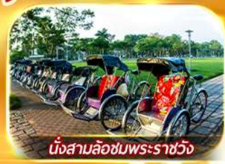
นั่งสามล้อชมพระราชวัง

สัมผัสความสวยงามหมู่บ้านสไตล์ฝรั่งเศสที่บานาฮิลล์ วัดเทียนมู่ พระราชวังเว้ สัมผัสเมืองโบราณฮอยอัน ล่องเรือกระดัง