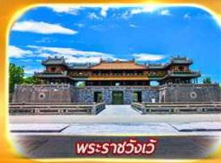
พระราชวังเว้