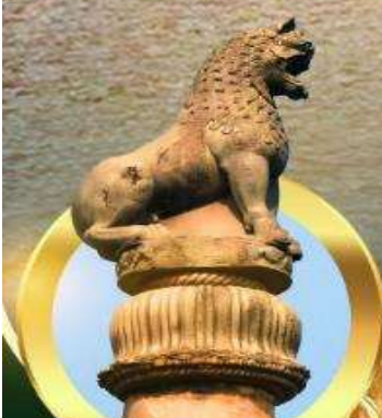
เสาศิวะสิงห์ ณ เวสาลี