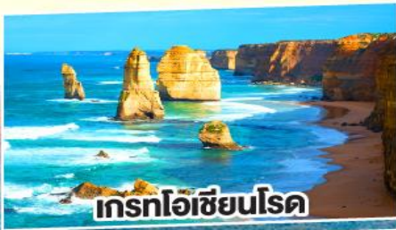
เกรทโอเซียนโรด