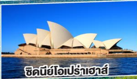
ซิดนีย์โอปราเฮาส์