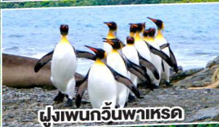
ฝูงเพนกวินพาเหรด