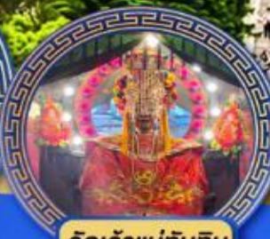
วัดเจ้าแม่ก๊วกทิม