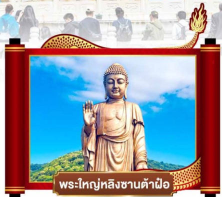
พระใหญ่หลังซานต้าผิง