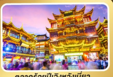
ตลาดร้อยปีเจิ้งหวงเมี่ยว