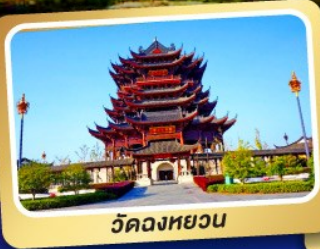
วัดฉงหยวน