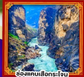
ช่องแคบเสื่อกระโจน