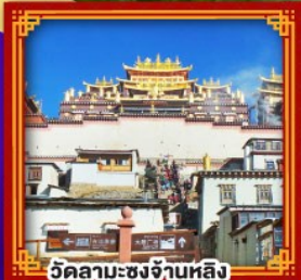
วัดลามะซงจันหลิง