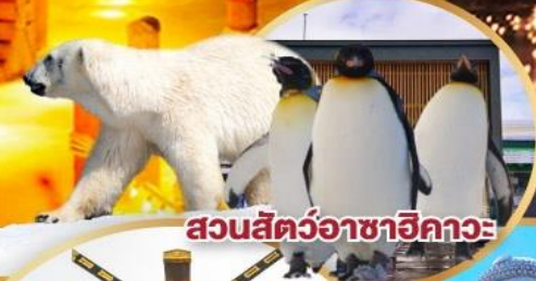
สวนสัตว์อาซาฮิกาวะ