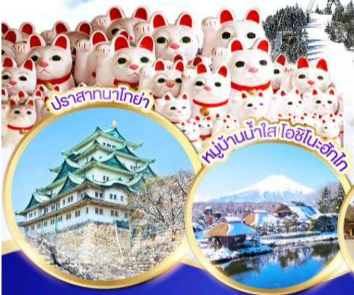
ปราสาทนาโกย่า