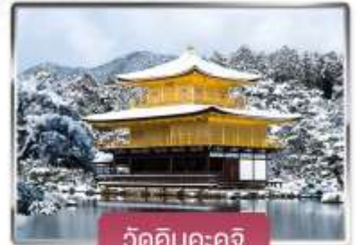
วัดคินคะคุจิ