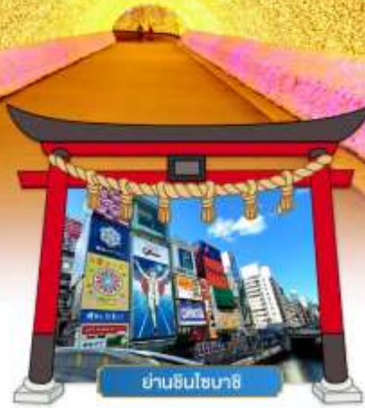
ย่านชินไซบาชิ