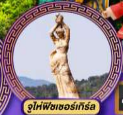
จูไห่พีชเชอร์เทิร์ล