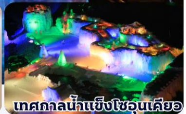
เทศกาลน้ำแข็งโซอุนเคียว