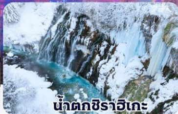
น้ำตกชิราอิเกะ