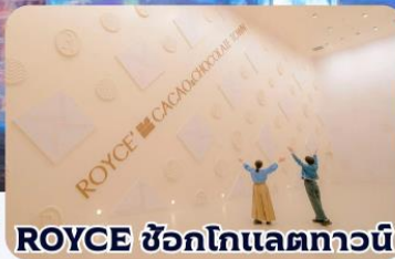
ROYCE ช็อกโกแลตทาว์น