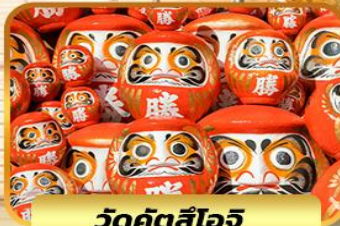
วัดคัตสึโฮจิ