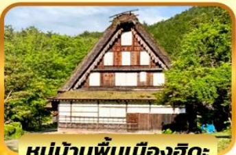
หมู่บ้านพื้นเมืองฮิดะ