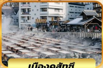
เมืองคุสัทซึ

วัดคัตสึโฮจิ วัดเบียวโดอิน วัดโกโตคุจิ หมู่บ้านพื้นเมืองฮิดะ หมู่บ้าน LITTLE KYOTO เมืองคุสัทซึ ชมยุบาทาเกะ เมืองเก่าคาวาโกเอะ ซ็อบบิงชินจุกุ อีออน คารุยชาว่าเอ้าท์เล็ต