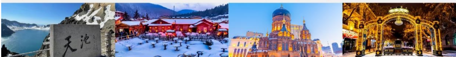
อุทยานฉางไป่ซาน