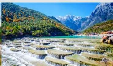
ทะเลสาบไป๋สุ่ยเหอ