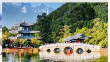
สระมังกรดำ

*ทางบริษัทฯ ขอสงวนสิทธิ์ในการสลับโปรแกรมทัวร์ตามความเหมาะสมขึ้นอยู่กับสถานการณ์หน้างาน โดยคำนึงถึงผลประโยชน์ของลูกค้าเป็นสำคัญ