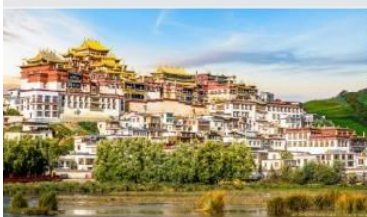
วัดลามะชงจ้านหลิน