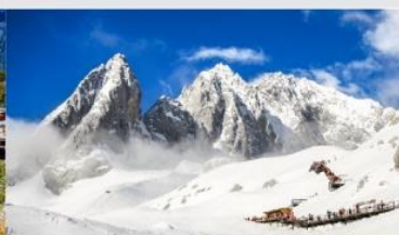
ภูเขาหิมะมังกรหยก