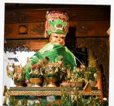
ขอพรแม่ยีเก๋