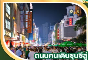
ถนนคนเดินซุนซีลู่