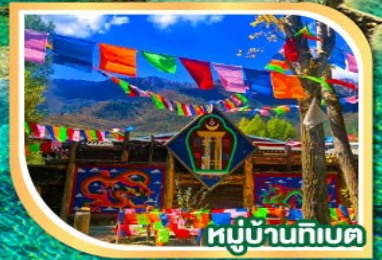
หมู่บ้านทิเบต