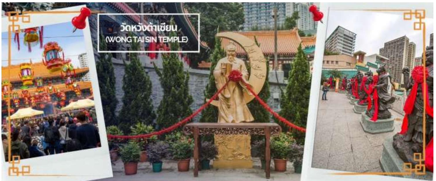
ผูกด้ายดวงชะตา ระหว่างคู่รักซึ่งเมื่อคู่กันแล้วก็จะไม่แคล้วคลาดกัน