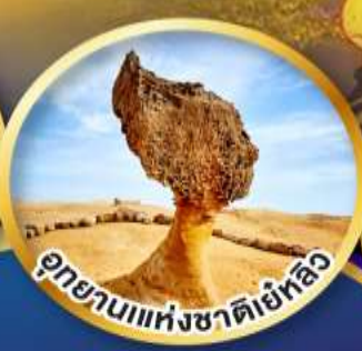
อุทยานแห่งชาติเย่หลิว