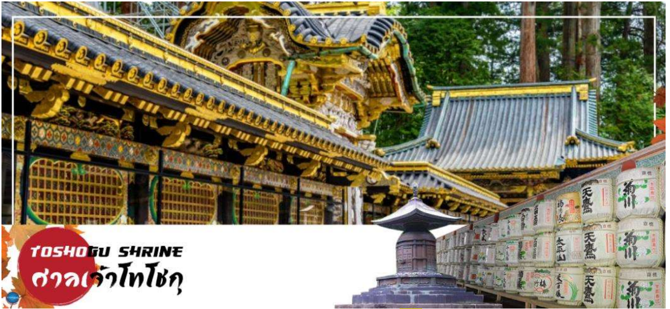
TOSHOGU SHRINE ศาลเจ้าโทโชกุ

เมืองนิกโกะ – ผ่านชม สะพานชินเคียว – ศาลเจ้าโทโชกุ – ศาลเจ้าฟูตาระ – จังหวัดไซตามะ – ย่านเมืองเก่าคาวะโกเอะ – ดรอกลูกกวาด – เมืองยามานาชิ – ออนเซ็น + ชาบูยักษ์