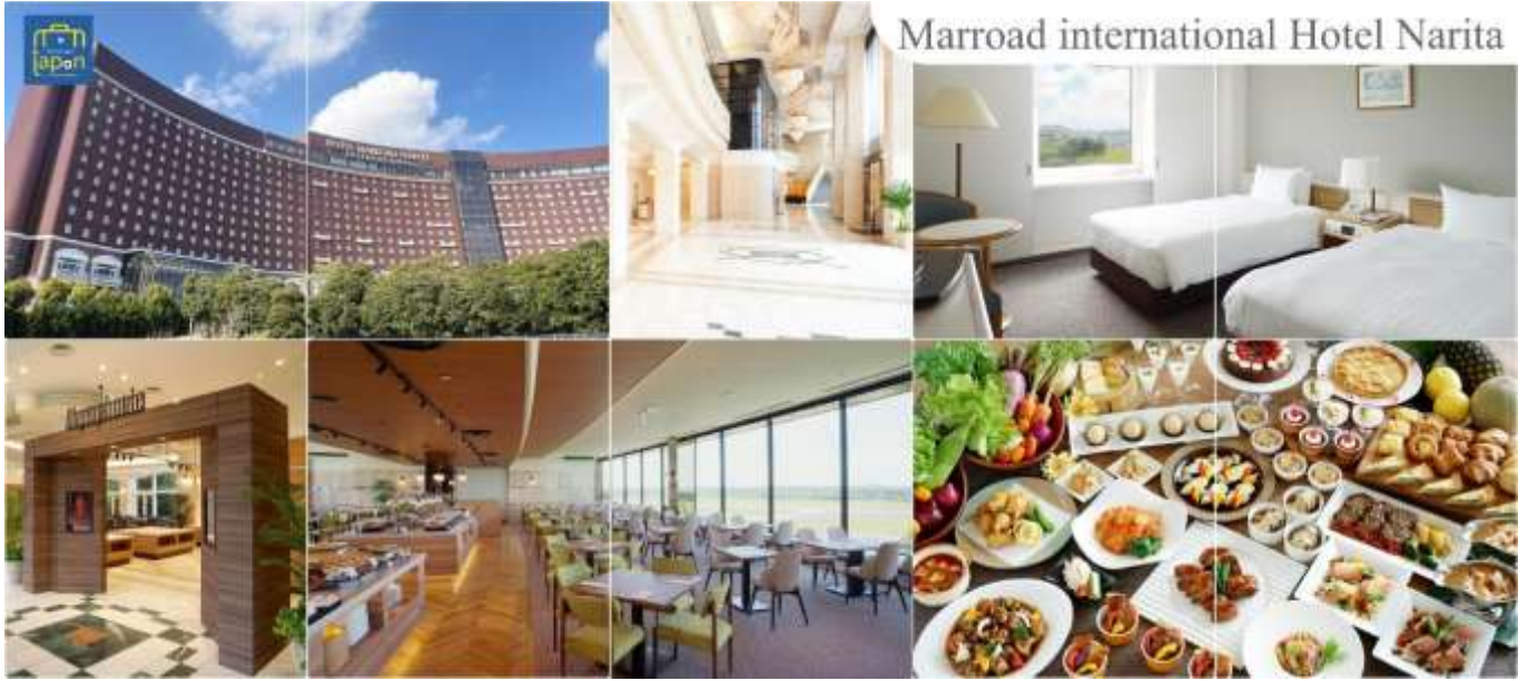
Marroad international Hotel Narita

MARROAD INTERNATIONAL HOTEL NARITA หรือเทียบเท่าระดับเดียวกัน