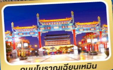
ถนนโบราณเทียนเหมิน