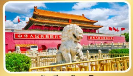
จตุรัสเทียนอันเหมิน