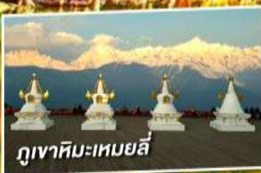
ภูเขาหิมะเหมยลี่