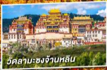
วัดลามะชงจ้านหลิม