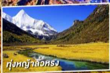
ทุ่งหญ้าลือหวง

เที่ยว 2 ภูเขาหิมะศักดิ์สิทธิ์ไปห่ม่า และ ภูเขาหิมะเหมยลี่ ชมใบไม้เปลี่ยนสี ณ อุทยานย่าตึง (ไม่ลงร้านช้อปปิ้ง + ไม่จ่ายออฟชั่น)