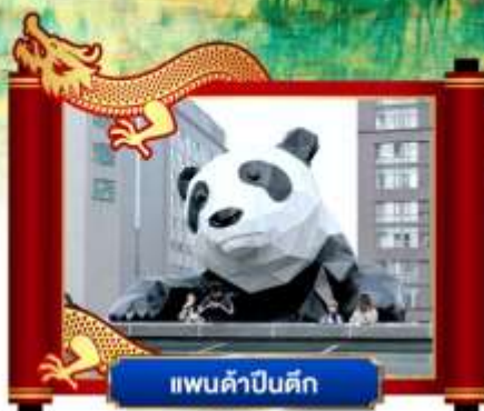
แพนด้าเซลฟี