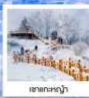
เขาถ้ำหกว้า