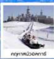
ฤดูหสนวอศการ