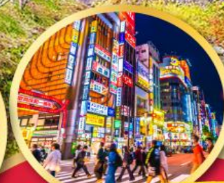
ช้อปปิ้ง ย่านชินจูกุ