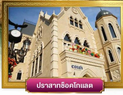
ปราสาทช็อคโกแลต