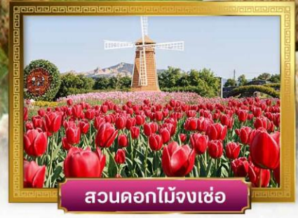
สวนดอกไม้จงเซ่อ