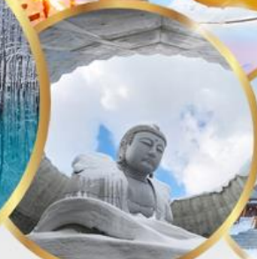
เป็นเขาแห่งพระพุทธรเจ้า