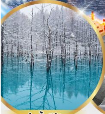
บ่อน้ำสีฟ้า