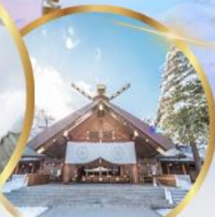
ศาลเจ้าออกโทโด