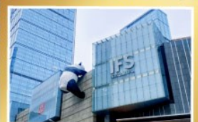
เพนด้ายักษ์บนตึก IFS