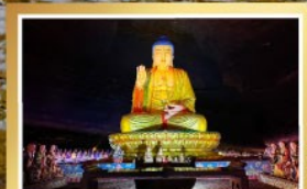
ภูเขาจินฝอซาน