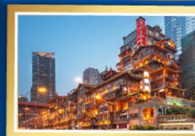
หยงหยาดัง