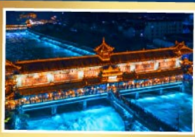
สะพานหนานเฉียว