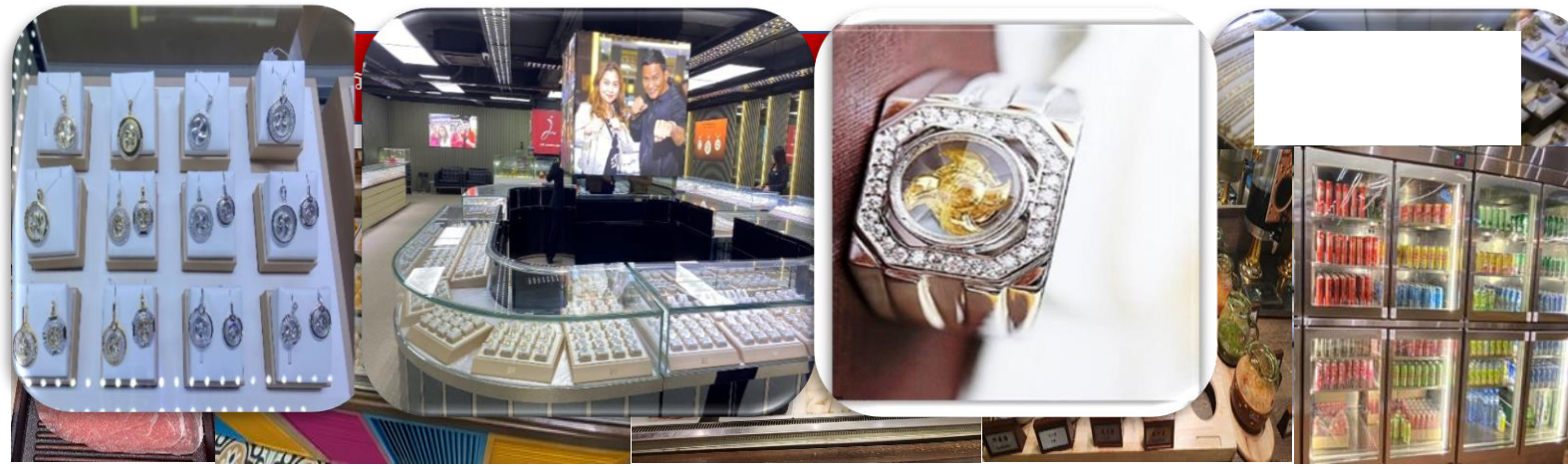
กลางวัน | บริการอาหารกลางวัน ณ ภัตตาคาร...เมนูพิเศษ ชาบูสไตล์ฮ่องกง