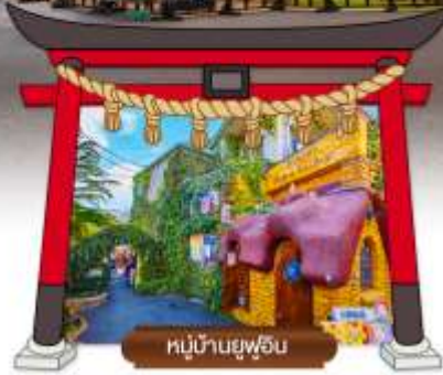
หมู่บ้านยูฟูอิน