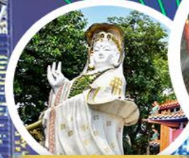
เจ้าแม่กวนอิม รัชพลส์ เบย์