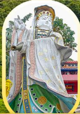
วัดเจ้าแม่กวนอิมรี พลัสเซนยี