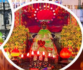
เจ้าแม่กวนอิมฮองงำ