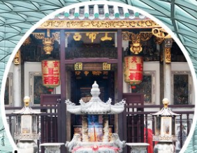
บู เรืองรัก ขอบรรณครว ขอลูก Yueh Hai Ching Temple

ทัวร์สิงคโปร์ 3วัน 2คืน โดยสายการบิน Thai Lion Air (SL)