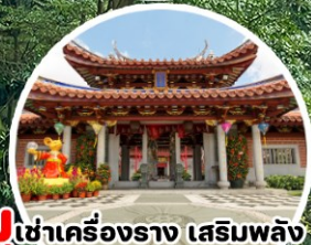
บู เช่าเครื่องราง เสริมพลัง Lian Shan Shuang Lin Temple