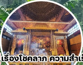
บู เรืองโชคลาก ความสำเร็จ Loyang Tua Pek Kong Temple