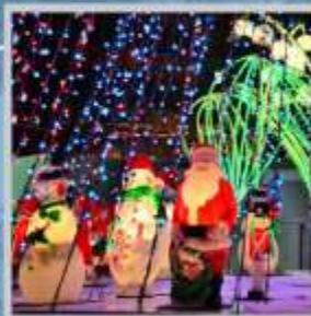
"ODORI GERMAN CHRISTMAS"