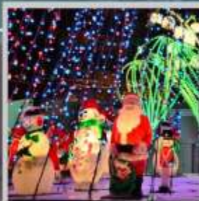
"ODORI GERMAN CHRISTMAS"