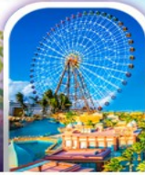
เมืองแฟนตาซี