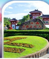
อุทยานหนานซาน

ทางเดินริมชายทะเลซานย่า - ทุ่งดอกกุหลาบอ่าวย่าหลง อุทยานหนานซาน - เทียบบนเกาะดอกไม้ - ทุ่งเกลือพินปี ช้อปปิ้งไนท์มาร์เก็ตถนนโบราณฉีไหลว