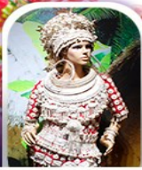
หมู่บ้านชนเผ่า