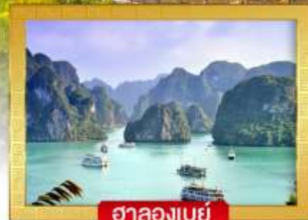
ฮาลองเบย์