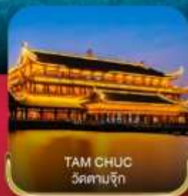
TAM CHUC วัดตามจิก