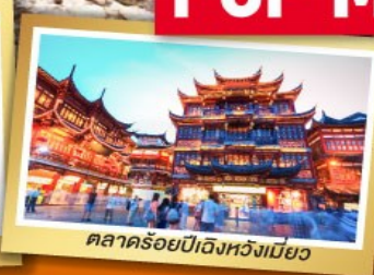
ตลาดร้อยปีเมืองหวงเมียว