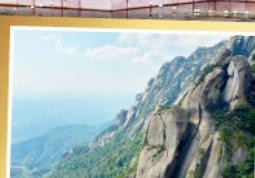
เขาหลงซาน